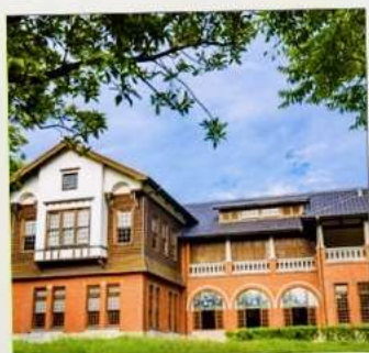
พิพิธภัณฑน์น้ำพุร้อนเป่ย์โถว