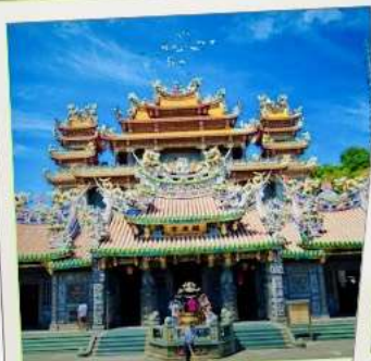
วัดกวนตู่