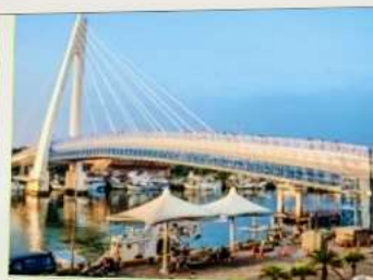
สะพานคู่รักตั้นส่วย