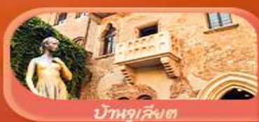
บ้านจูเลียต