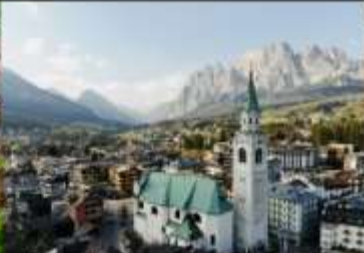
เมืองเมืองคอร์ตีนา ดัมเปโซ