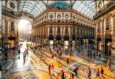
Shopping เมือง Milan