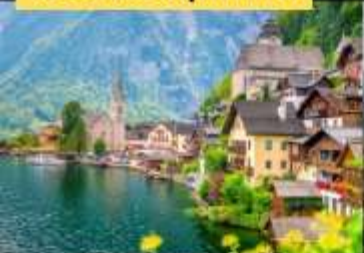
เมืองอัลสตัดท์