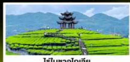
ไร่ชาอูโตเจีย