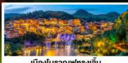
เมืองโบราณฟุทงเจิ้น