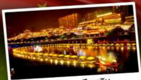
เมืองโบราณเซียนเ็น

เที่ยว 2 เมือง จางเจี๋ยเจีย & เ็นซือ ล่องเรือแคนยอนผิงชาน เทียบหุบเขาอวตาร