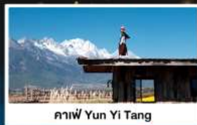
กาแฟ Yun Yi Tang