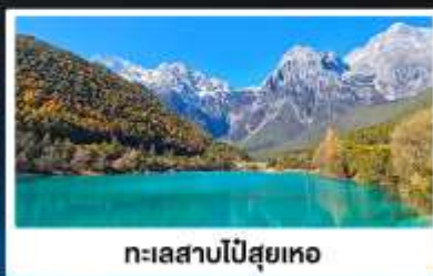
ทะเลสาบโป๋ส่วยเหอ