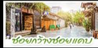
ชอยกว้างชอยแคว