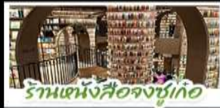
ร้านหนังสือจุงซูเก๋อ