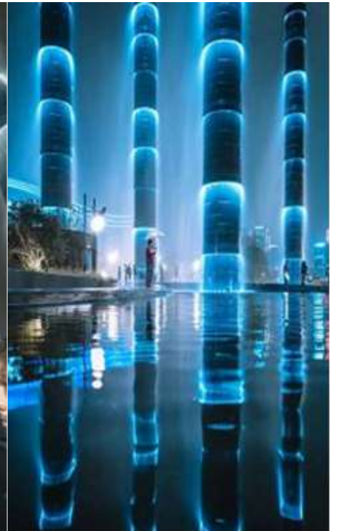
นำท่านชม ไฟน้ำพุไม้ไฟติ๊กSKP แสงสียามค่ำคืนที่ ลานห้างสรรพสินค้า SKP แลนด์มาร์คแห่งใหม่