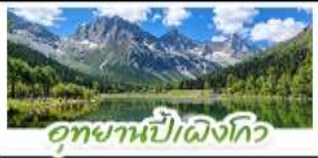
อุทยานป่าผึ้งโกว

อุทยานสีดรุณี • อุทยานป่าผึ้งโกว • เมืองคูเจียงเยียม รูปปั้นหมีแพนด้าอมเซลฟ์ • ร้านหนังสือจุงซูเก๋อ • วัดต้าอือ ถนนโบราณชอยกว้างชอยแคว • ถนนคนเดินซุนซีสู๋ • ถนนโต้กู่หลี่ หมีแพนด้าปิ่นตัก IFS • ชมแสงสีน้ำพุไม้ไฟตัก SKP • ชมตึกแฝดเจิ้งตุ