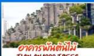
อาคารพันต้นไม้อิ๋นเทียนอันพันต้นไม้อิ๋นเทียนอัน