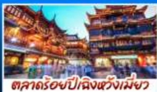
ตลาดร้อยปีผิงหวังเม้งว