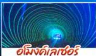
ตุ้มงคิเลาซอร์