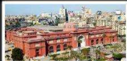
พิพิธภัณฑ์สถานแห่งอียิปต์