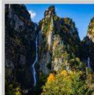
"GINGA & RYUSEI FALLS"

ต้นตอ "ทุ่งดอกพืชมอส ณ สวนดอกชิบะซากุระ-อิงะชิโมะโคะโคะ" ด้วยพรมสีชมพูที่มีพื้นที่ขนาดใหญ่ถึง 100,000 ตารางเมตร ชม "ทะเลสาบคาบสมุทรชิเรโตโกะ" เกิดมาจากการระเบิดของภูเขาไฟโอเอและน้ำพุใต้ดิน จนเกิดเป็นทะเลสาบทั้ง 5 ของชิเรโตโกะ "ฟาร์มสุนัขจิ้งจอกฮอกไกโด" ฟาร์มสุนัขจิ้งจอกแห่งเดียวของเกาะฮอกไกโด สายพันธุ์ท้องถิ่นคือ สายพันธุ์ Ezo red fox เพลิดเพลินกับ "เนินสีฤดู" เนินเขากว้างใหญ่ที่มีดอกไม้ไม้บานาพันธุ์นับ 30 ชนิดปลูกเรียงรายสลับสีกันเป็นแนวยาว นำท่าน "นั่งกระเช้าภูเขาคุโรดะเคะ" เชื่อมจากเชิงเขาของเมืองโซอุนเคียวถึงยอดเขาคุโรดะเคะที่มีความสูงถึง 670 เมตร ไฮไลท์ "ส่องเรือราอูสี ชมความงามของวาฬเพชรฆาต" บริเวณคาบสมุทรชิเรโตโกะ มรดกโลกทางธรรมชาติของฮอกไกโด