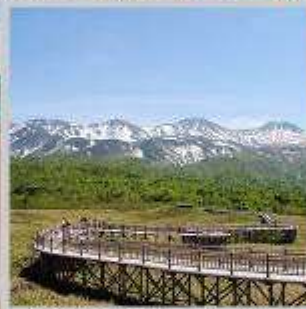
"SHIRETOKO 5 LAKE"