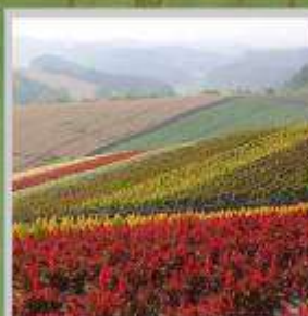
"SHIKISAI NO OKA"