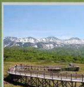
"SHIRETOKO 5 LAKES"