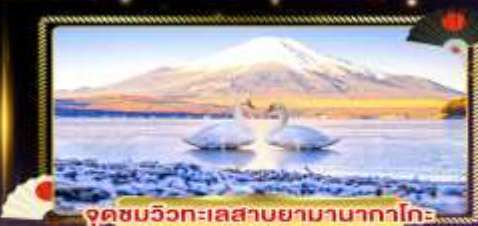
จุดชมวิวกะเผลสาบยามานากาโกะ