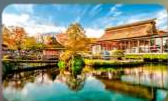
โอชิโนะ ฮิคโค