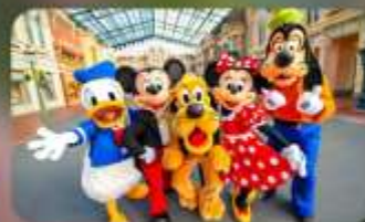
ดิสนีย์อีสระ