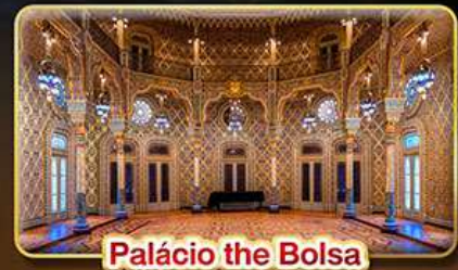
Palácio the Bolsa