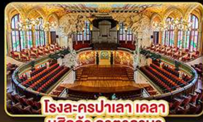
โรงละครปาลาเลา เดลา มูสิกา คาคาลานา