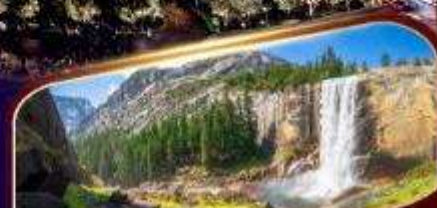
อุทยานแห่งชาติโยเซมิตี

พักลาสเวกัส 2 คืน เต็มอิ่มกับแสงสีแห่งอเมริกา