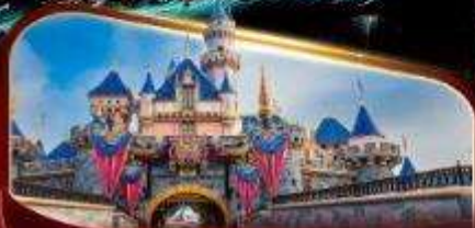
ดิสนีย์แลนด์พาร์ค