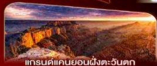
แกรนด์แคนยอนฝั่งตะวันตก