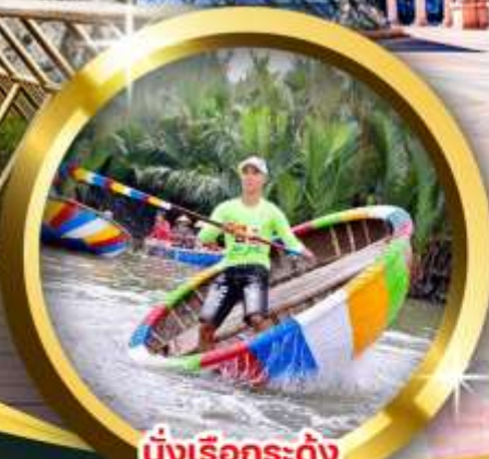
นั่งเรือกระดิ่ง