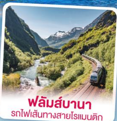
ฟลัมส์บานา รถไฟเส้นทางสายโรเมนติก