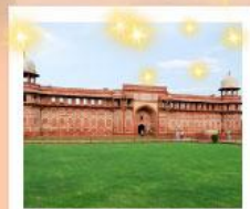
Ajmer Sharif Dargah