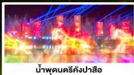
น้ำพุคนตรีคังปาสือ