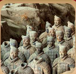
“สุสานจีนซีฮ่องเต้”