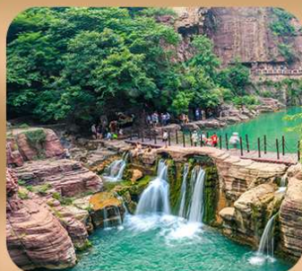
“อุทยานหยุนไท่ซาน”

ชมถ้ำหลงเหมิน มรดกโลกที่เมืองลั่วหยาง • สุสานจีนซีฮ่องเต้ • ศาลเจ้ากวนอู วัดเส้าหลิน + ป่าเจดีย์ + ชมโชว์กังฟู • เมืองโบราณลั่วอี้ • อุทยานหยุนไท่ซาน เจดีย์ห่านป่าใหญ่ • ถนนวัฒนธรรมต้ากิง • ถนนคนเดินอิสลาม • จัตุรัสหอระฆัง