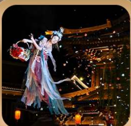
“เมืองโบราณลั่วอี้”

ชมถ้ำหลงเหมิน มรดกโลกที่เมืองลั่วหยาง • สุสานจีนซีฮ่องเต้ • ศาลเจ้ากวนอู วัดเส้าหลิน + ป่าเจดีย์ + ชมโชว์กังฟู • เมืองโบราณลั่วอี้ • อุทยานหยุนไท่ซาน เจดีย์ห่านป่าใหญ่ • ถนนวัฒนธรรมต้ากิง • ถนนคนเดินอิสลาม • จัตุรัสหอระฆัง