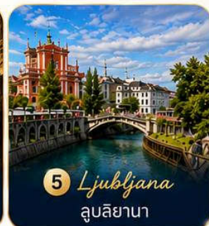
5 Ljubljana ลูบลิยานา