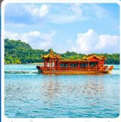
ล่องเรือทะเลสาบหลิวเยวู่