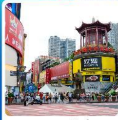
ถนนหลงซิงอู่