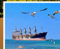
เรือสินค้าก่ายตันบลูวิส