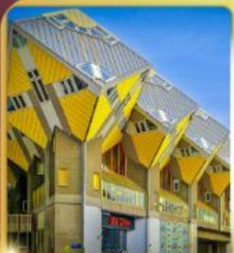
บ้านลูกเต่า โลกคู่บารมี

“ล่องเรือหลังคากระจก” ชมกรุงอัมสเตอร์ดัม