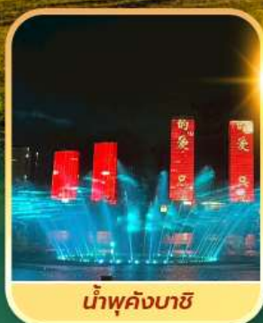
น้ำพุคังบาซี