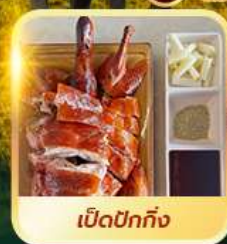
เบ็ดปักกิ้ง