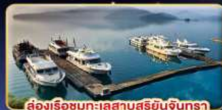
ส่องเรือชมทะเลสาบสุริยนจินตรา