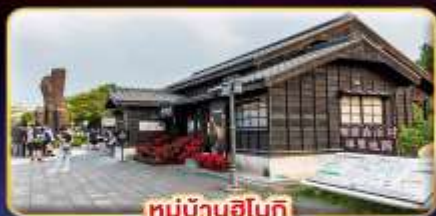
หมู่บ้านฮินเก้

"ไทเป" มหานครแห่งเมืองสี่พัน เที่ยวจุใจ เช็กอินจุดไฮไลท์