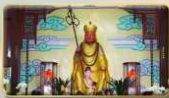
วัดพระกั๊งซำจั้ง