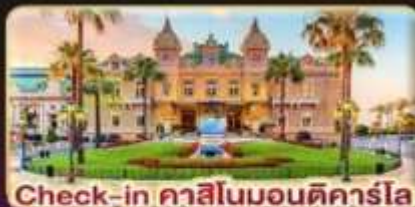
Check-in คาสีโนมอนติคาร์โล