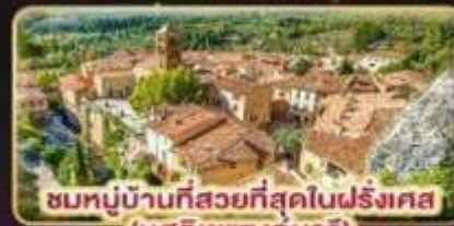
ชมหมู่บ้านที่สวยงามที่สุดในฝรั่งเศส (มูสดีเยแซงมาร์)