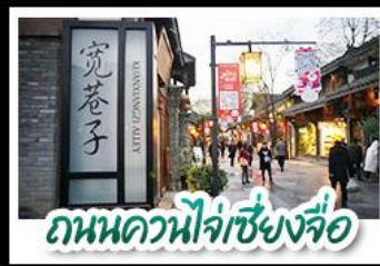
ถนนควนโจ้วเซียงจื่อ