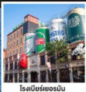
โรงเบียร์เยอรมัน