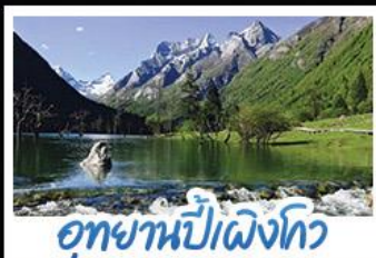
อุทยานปี่เผิงโกว

ภูเขาสัปดาห์นี้ อุทยานจิวจ้ายโกว นั่งรถไฟความเร็วสูง น้ำพุไม่ไผ่ตักSKP อุทยานปี่เผิงโกว วัดต้าฉือ ถนนโบราณชอยกวางชอยแคบ ช้อปปิ้งถนนไถ่กู่หลี่ + ถนนซุนซีลู่