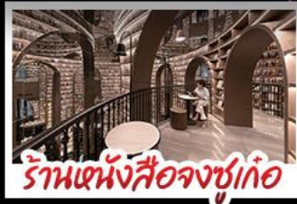
ร้านหนังสือจขูเกอ

อุทยานภูเขาสี่ดรุณี อุทยานปี้เฟิงโกว หมู่แพนด้าอนแซลพี ร้านหนังสือจขูเกอ วัดต้าฉือ ถนนโบราณความจำ ซ้อปิ้งย่านคิง ถนนไท่กู่หลี่ + ถนนซุนซู่ เมนูพิเศษ สุกี้หมาล่าเสวณ