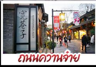
ถนนความจำ