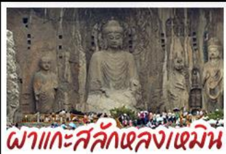
พิกัดศิลปะหลงเหมิน

เที่ยวครบ 4 มรดกโลก ถ้ำหลงเหมิน - สุสานจีนซีอองเต้ - วัดเส้าหลิน หมู่บ้านไต้คินสำโจว - หมู่บ้านกัวลิ่งซุน