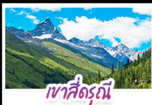
เขาสีดรุณี