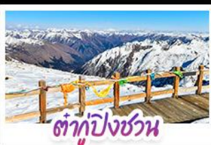
ต้ากู่ปิงชวณ