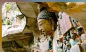
ฆาตินแกะสลักต้าจู้