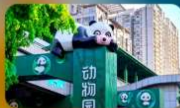
สถานีหมี่แพนด้า