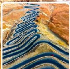
ถนนผานหลงกู่ต้าว