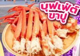
บุฟเฟ่ต์ ภูเขา