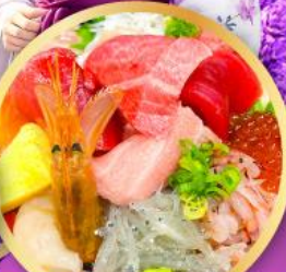
ตลาดปลาชิบิสุ คาชิโนะจิ

ถ่ายรูปเชคอินวิวฟูจิ กับซุ้มประตูโทเซคิจิ แซนมอน