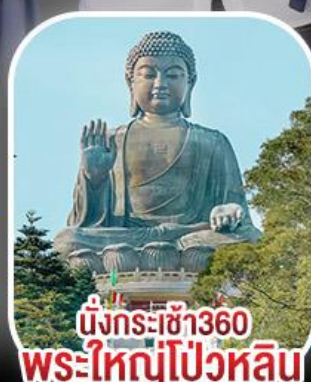
นั่งกระเช้า360 พระใหญ่โป้วหลิน