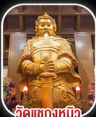
วัดเขกงหนิว

สวนสนุก CHIMELONG SPACESHIP PARK เจ้าแม่กวนอิมร์พลิสเบย์ - เจ้าแม่กวนอิมฮ่องกง วัดเขกงหนิว - พระใหญ่องปิง+กระเช้า เมนูสุดพิเศษ!! เป้าอ้อ+ไวน์แดง , ห่านย่าง