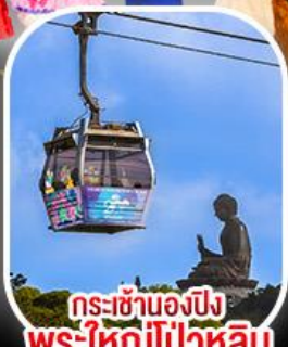
กระเช้าเองปีง พระใหญ่ไผ่หลิน