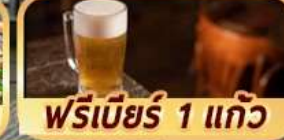
ฟรีเบียร์ 1 แก้ว