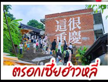
ตรอกซี่ย่าวหลี่