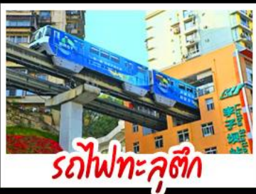
รถไฟทะลุคิก