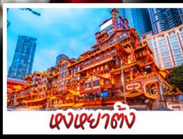
แดงหยาดัง