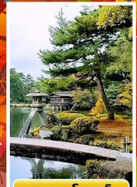
สวนเคนโรคุเอ็น

🍵 ออนเซ็น 3 คั้น 🧳 นน.กระเป๋า 23 กก. ☀️ 7Days 5Night