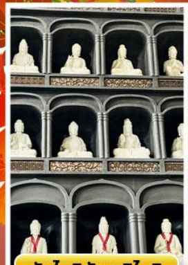
วัดไดชิซังเซอิไดจิ