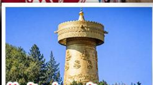
วัดต้าฝอ กงล้อมณฑล