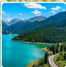
อุทยานเทียนชาน เทียนฉือ