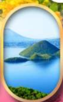
วิวทะเลสาบโทโยะ