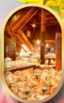
พิพิธภัณฑ์ถ้ำถ้ำดนตรี