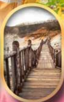
หุบเขาจิทอกุตามิ