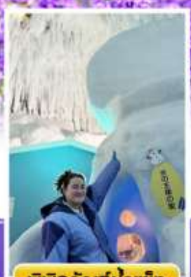
พิพิธภัณฑ์น้ำแข็ง