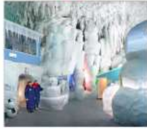
พิพิธภัณฑ์น้ำแข็ง