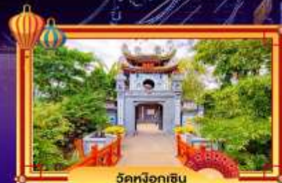
วัดฝอยหิน