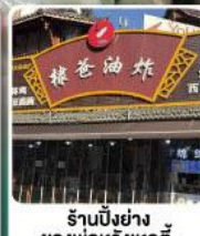
ร้านปิ้งย่าง ของพ่อหวังเหอตี้