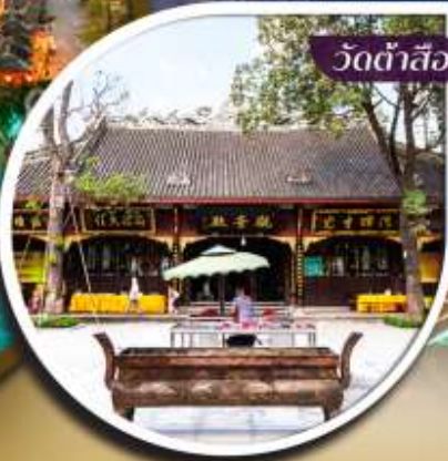
วัดต้าสือ