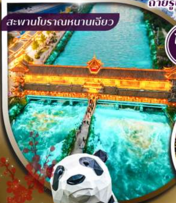
สะพานโบราณหนานเจียว

ชมความงดงาม สะพานโบราณหนานเจียว ระดับ 5A สักการะ วัดต้าสือ ถ่ายรูปแลนด์มาร์คดัง แพนด้ายักษ์เซลฟี และ แพนด้าป็นตึก