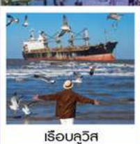
เรือบลูอิส