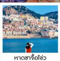
หาดซาโจอ่าว