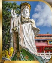
เจ้าแม่กวนอิม ริพลัสเบย์