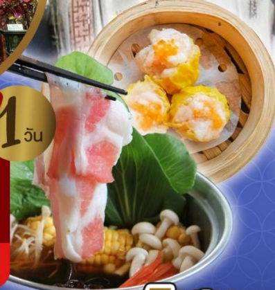
เจ้าแม่กวนอิม ริพลัสเบย์