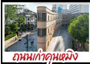
ถนนเก๋าคู่หมิง