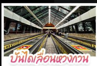
บันไดเลื่อนแขวงกวาน